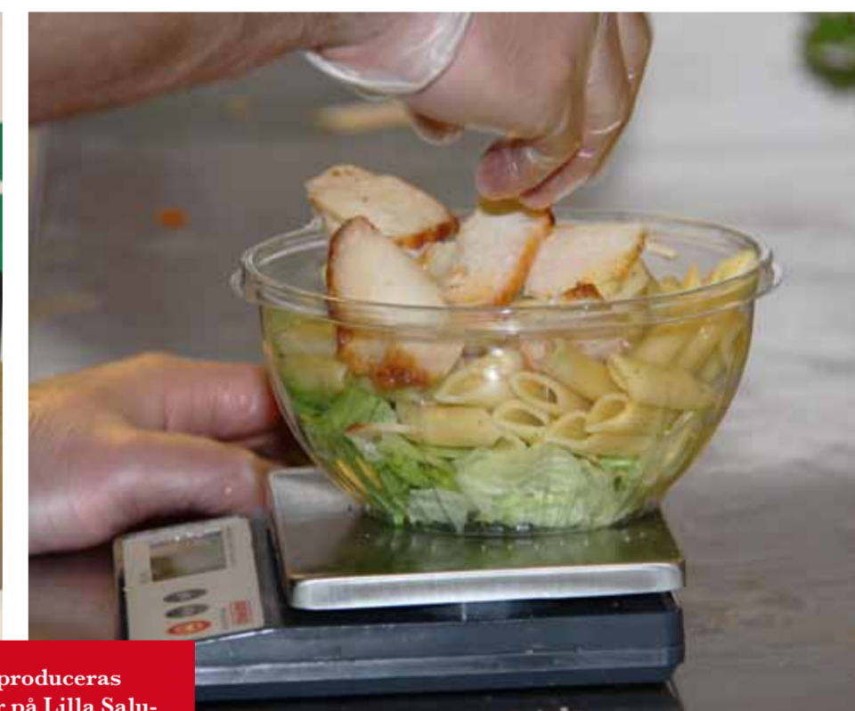
Varje vecka produceras 5700 sallader på Lilla Saluhallen. En viktig leverantör av de pinfärska grönsakerna är Färskvarucentralen.