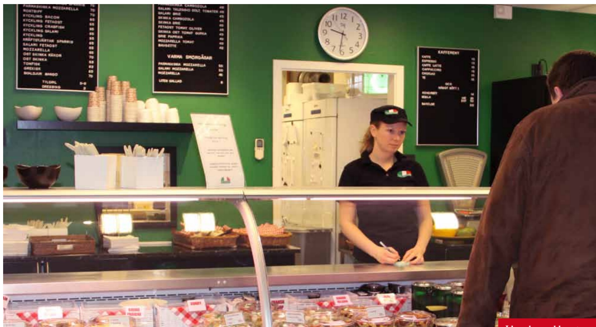
Idag ska snabbmat vara nyttigt för att funka.